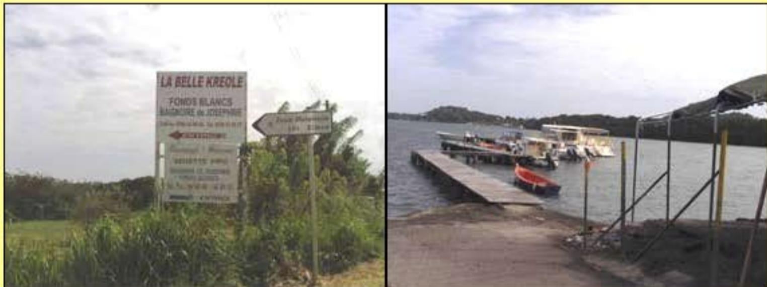
1) Panneaux indicateurs, direction la Baie du Simon et la Belle Créole.