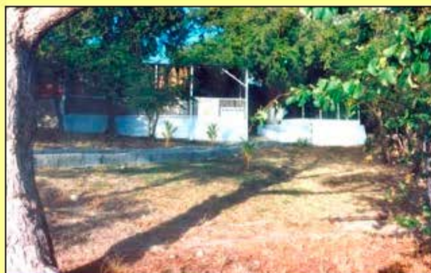
Notre lieu de restauration et de détente sur l'île Thierry